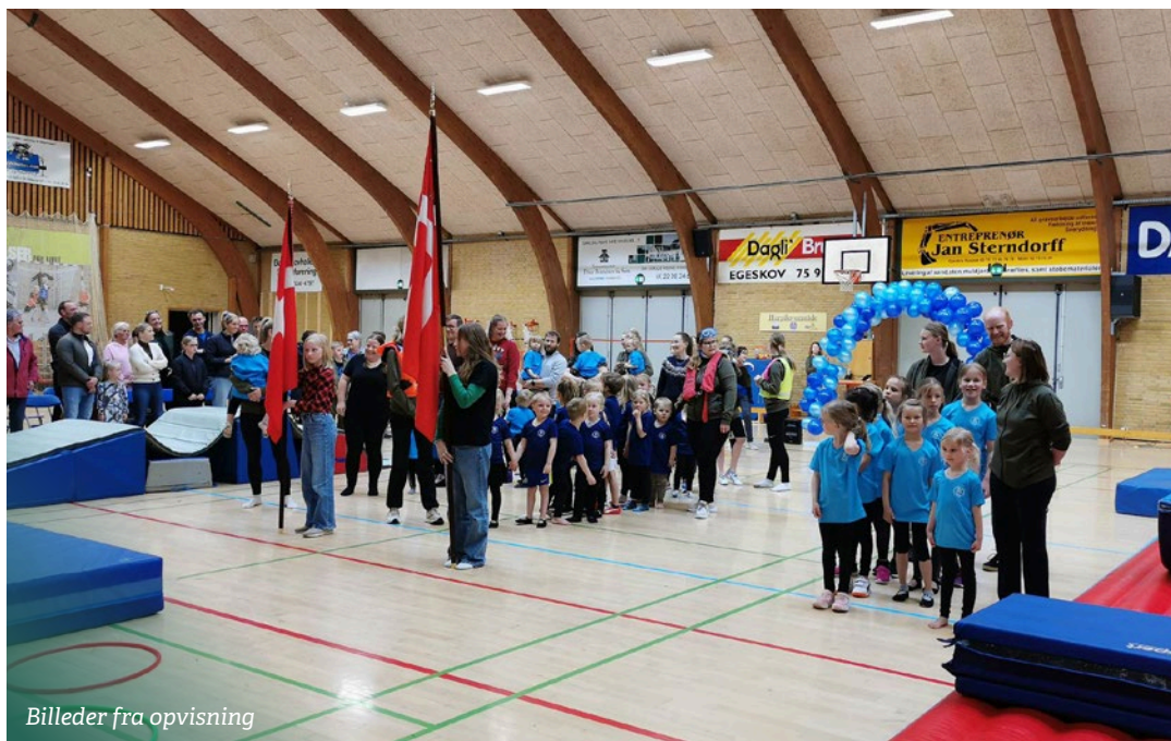
Billeder fra opvisning

Kl. 20.30-21.00: møde for den nye bestyrelse